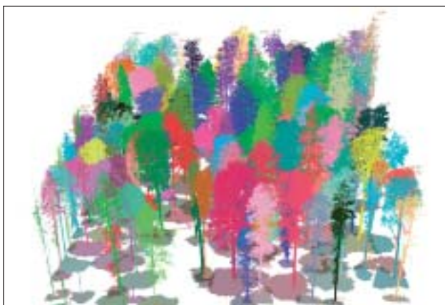
Vizualizace části Boubínské pralesa s využitím technologie pozemního laserového skenování a zpracování dat v software 3D Forest.

Protože pokrok nelze zastavit a nové metody sběru a zpracování dat v kombinaci s robustními daty v již čtyřicetileté časové řadě mají čím dál větší vypovídací schopnost, začali jsme se zabývat využitím sběru dat pomocí pozemního laserového skenování, jako potenciálně nejpřesnější technologie sběru prostorových dat pro naše výzkumy. Bylo třeba vyřešit nejenom technické otázky sběru dat a propojení s dosavadními datovými řadami, ale zejména otázku co nejvíce automatizovaného zpracování dat z mračen naskenovaných bodů. To vedlo k vývoji vlastního software 3D Forest ( www.3dforest.eu ), který vede kolega J. Trochta. Zpracovaná data nabízejí zcela novou dimenzi prostorových analýz – umožní modelovat potenciální oslunění a jeho vliv na růst stromů, studium prostorových vzorů a kompetičních vztahů v 3D prostoru – tedy včetně vlivu korun, které jsou pro kompetici dřevin zásadní apod.